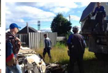
Фото автора Марина Заболотская, главный специалист отдела социальной политики администрации городского поселения Приобье

вокруг опор электростолбов и дорожных знаков.